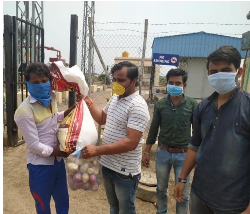
Distrito de Bagalkote, Karnataka, la India.

En particular, la devastación a la que se enfrentó la India fue una realidad inimaginable para muchos, incluidos nuestros empleados locales. En abril de 2020, la dirección de Amp India entró en acción e ideó una estrategia para apoyar a más de 390 empleados repartidos en 5 sedes diferentes mediante el apoyo de raciones de alimentos y ayuda financiera. La ayuda en forma de raciones de alimentos permitió que Amp India llegase a un total de 190 trabajadores en los centros de Payagpur, Bandali, Jamkhandi, Achampeth y Tuljapur. Cada paquete de ayuda llevaba productos esenciales para que los miembros del equipo pudieran mantener a sus familias. Además de las raciones de alimentos, Amp pudo proporcionar más de 40.000 dólares canadienses de ayuda financiera, repartidos en partes iguales entre 209 empleados. Cuando las cifras de COVID-19 empezaron a aumentar de forma alarmante en 2021, la dirección de Amp India decidió proporcionar un mes de apoyo en forma de raciones de alimentos a 10 centros en medio del confinamiento que se estaba aplicando en toda la India. Además de los centros de Bandali, Jamkhandi, Achampeth y Tuljapur, Amp pudo ayudar a los trabajadores de otros 6 centros: Begampur, KMRL 1 y 2, VW, THCM 1 y 2, K5, y MH-02. La dirección de Amp India apoyó a más de 650 miembros de la comunidad durante estos tiempos sin precedentes, dando un ejemplo increíble de lo que significa ser un verdadero socio de la comunidad.